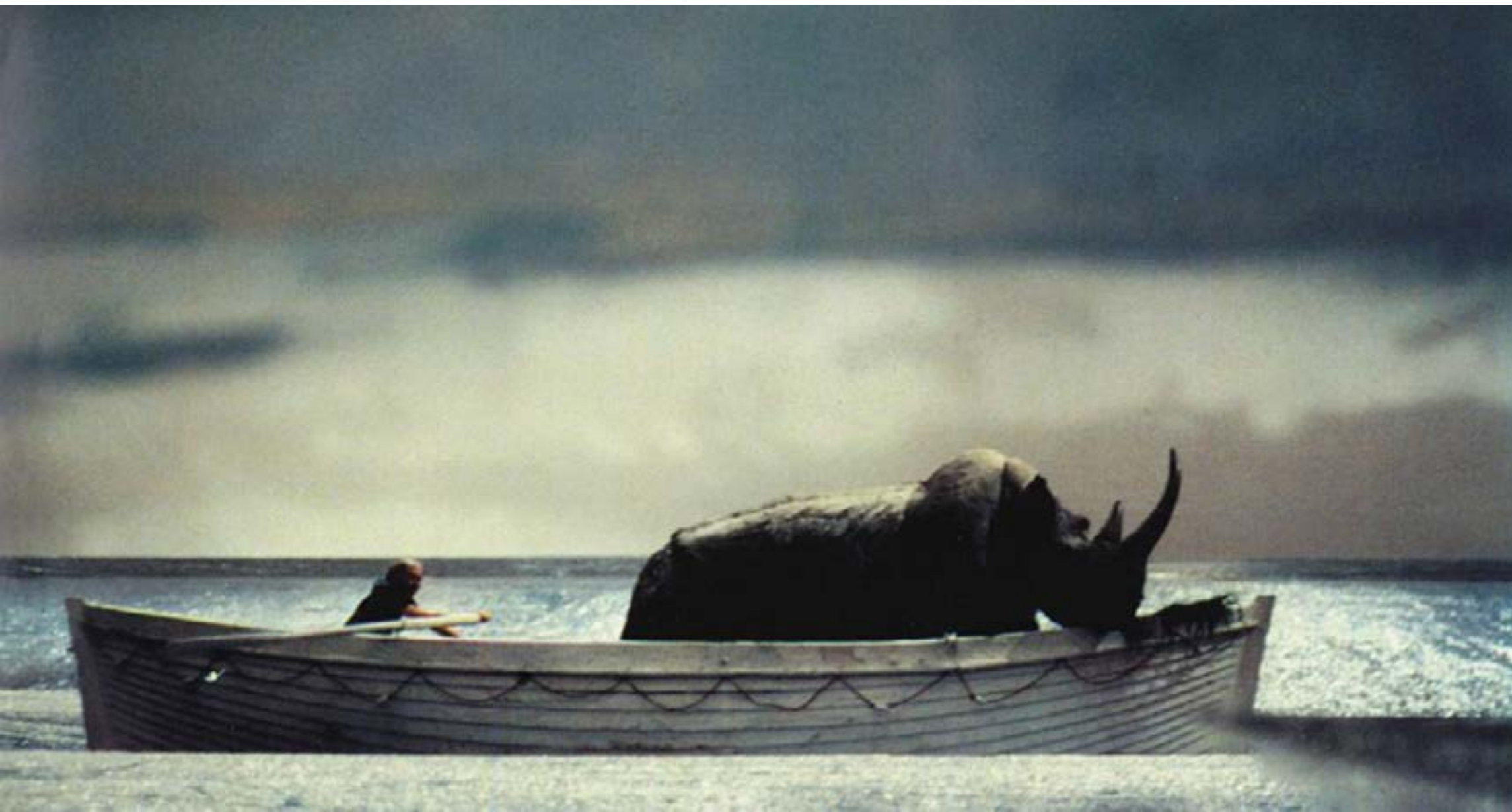
y la nave va- Fellini

Justo es reconocer que no siempre anduvo el rinoceronte embistiendo a ciegas, supo también viajar en barco, recorrer el mundo y naufragar a las puertas de Roma.