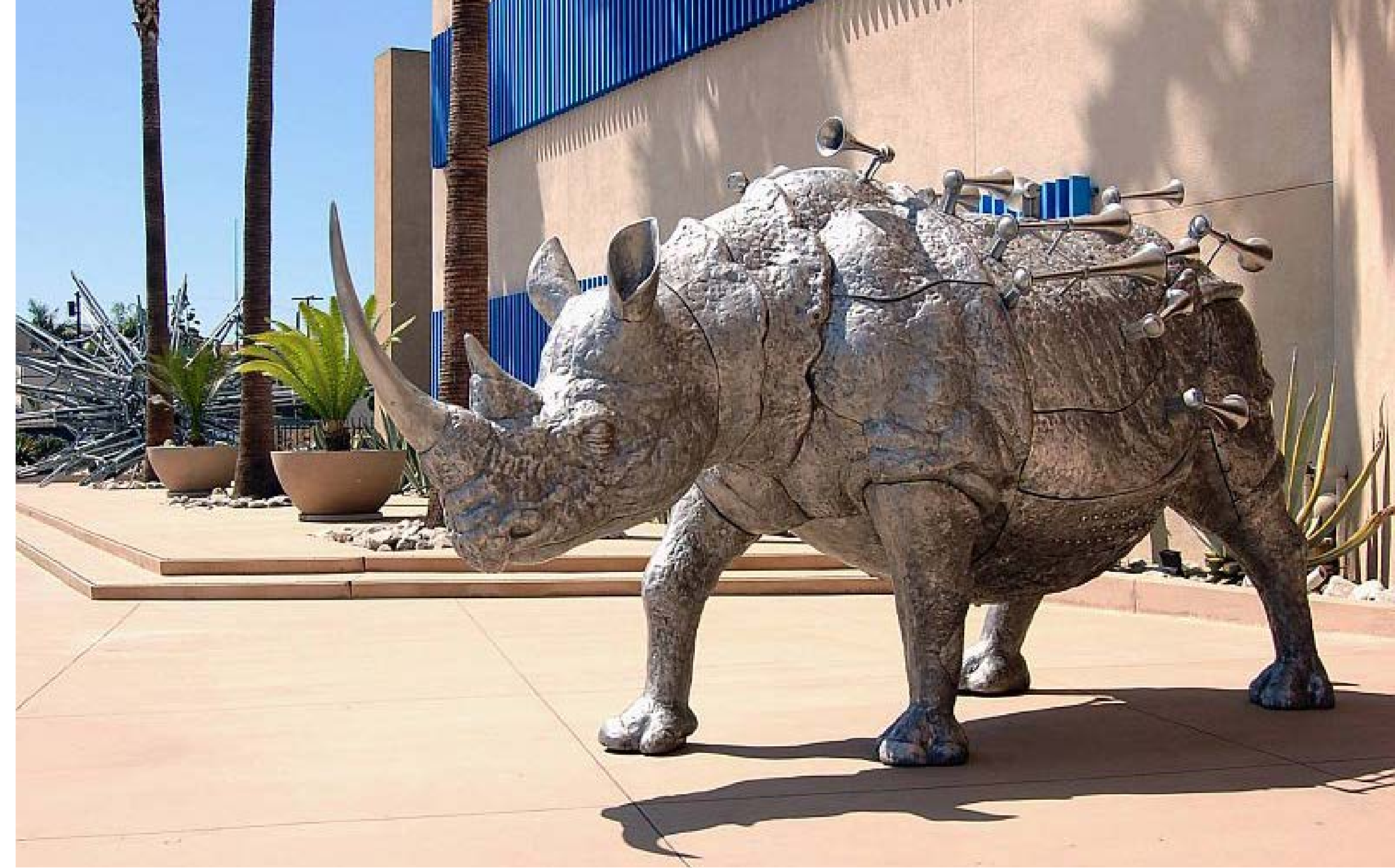
“Hecho en Cuba” Museo de Arte Latinoamericano (MOLAA), Long Beach, Los Ángeles (California, EE.UU./ LA, CA, USA

Fernando Pessoa quizás sea el ejemplo más ilustrativo de la escritura como un diálogo con otros: es sabido que la mañana del 8 de marzo de 1914 (según él mismo lo consigna en una misiva a la gente de Presença) apareció “en” Fernando Pessoa alguien a quien él reconoció casi de inmediato como Alberto Caeiro. No fue alumbramiento, fue en todo caso toparse de pronto con una presencia inesperada en su intimidad. Este acontecimiento puso a “Pessoa” por unos instantes en estado de inexistencia (aún más que de turbación). Tampoco se trató de una usurpación de orden