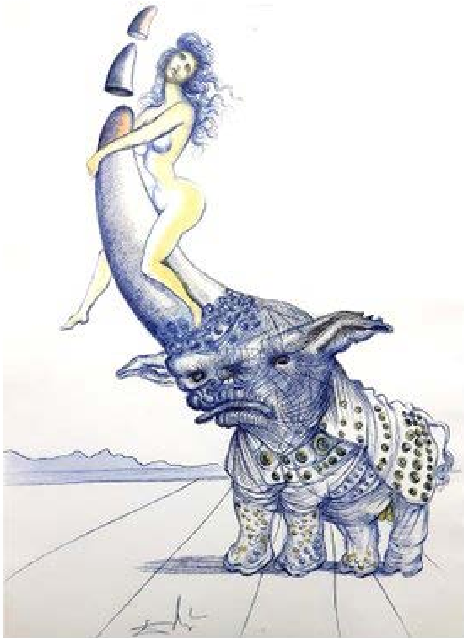
Chica sobre cuerno de rinoceronte 1967 Salvador Dalí

haber sido llevado a Florencia por los Medici, o que fue destruido en el saqueo de Roma allá por 1527. Su increíble historia inspiró la novela de Lawrence Norfolk: El rinoceronte del papa , del cual tomamos muchos datos dándoles por verdaderos porque así se nos antoja.